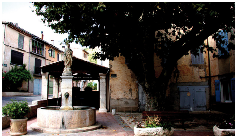
La place du village