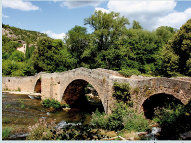
Le pont dit « romain »