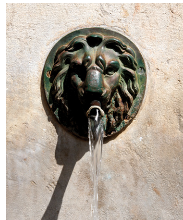
Détail de la fontaine

En 1540 le nouveau bourg compte déjà 30 maisons. Il n'a depuis lors cessé de se développer à partir de son noyau primitif, jusqu'au paysage urbain que l'on connaît de nos jours.