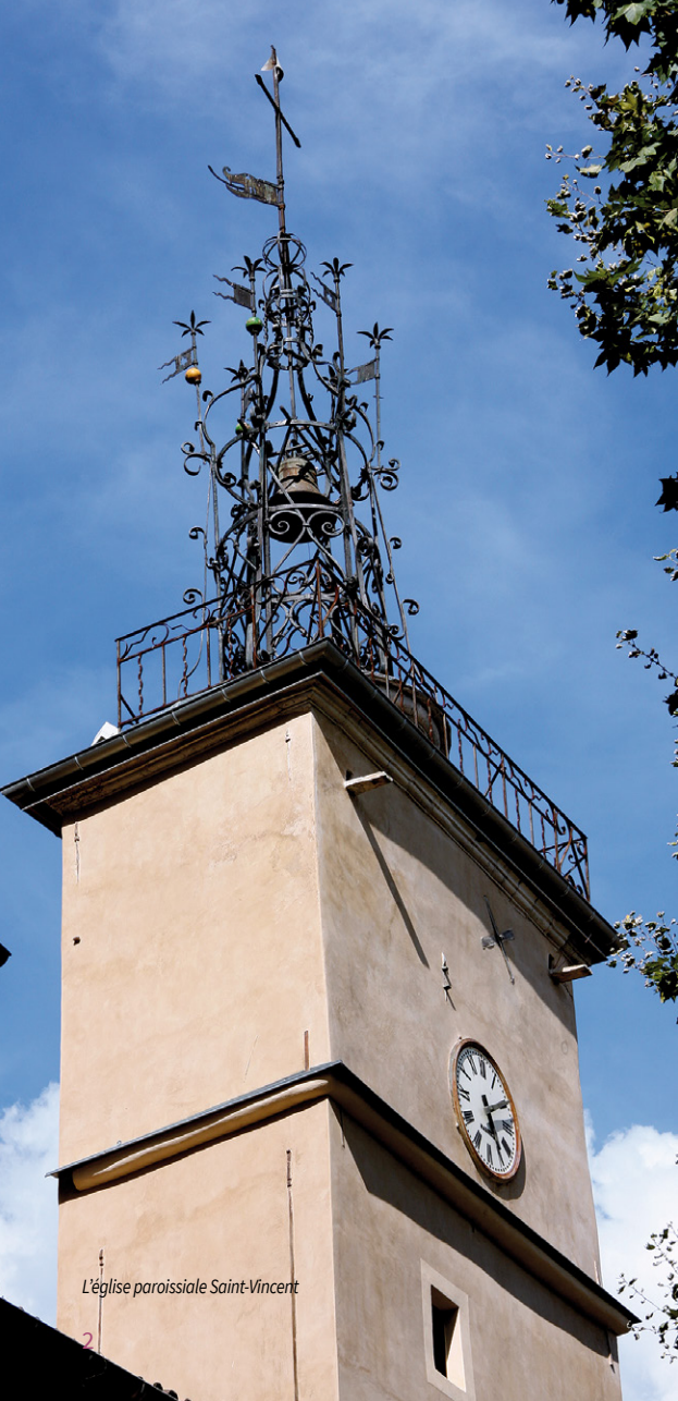
L'église paroissiale Saint-Vincent

Le Pays d'art et d'histoire et l'Office de Tourisme Provence Verte & Verdon vous proposent de découvrir l'histoire, le patrimoine et les curiosités de leurs villages, au travers de cette brochure de la collection Parcours.